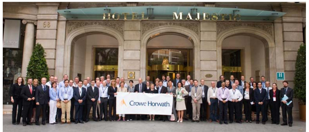
Die Teilnehmer der diesjährigen EMEA Tax Conference in Barcelona

Ziel der einzelnen Workshops war es unter anderem, durch fachliche Diskussionen zu aktuellen Themen die grenzüberschreitende Zusammenarbeit innerhalb des Crowe Horwath-Verbundes zu intensivieren. Zudem wurden zahlreiche Gastvorträge gehalten, so z. B. zum Thema Verrechnungspreise aus