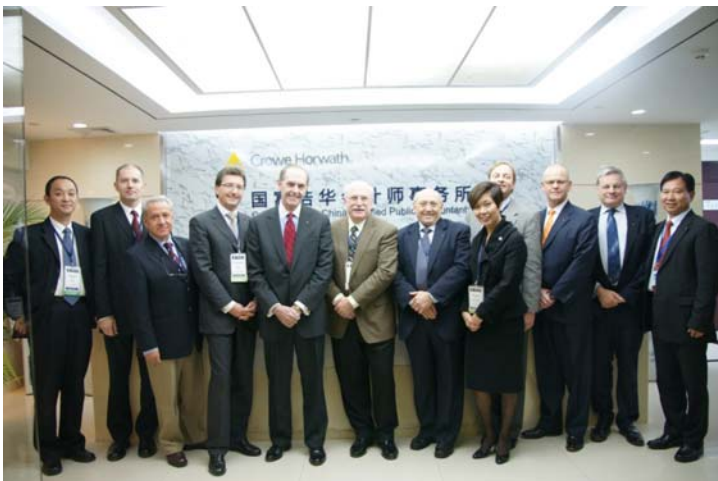
Empfang des Board of Directors im Büro unserer neuen chinesischen Partnerfirma